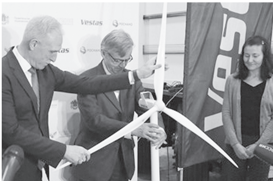
Производство компонентов ВЭУ создано в рамках специального инвестиционного контракта между «Вестас Мэньюфэкчуринг Рус», Минпромторгом РФ и областью. Специнвестконтракт, заключенный на восемь лет, стал первым в отечественном энергомашиностроении.

«Нам важно построить здесь, в Ульяновске, такое производство, которое будет конкурентоспособным не только в России, но и за рубежом. А такой источник энергии, как ветер, сам по себе кон-